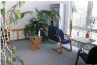
Praxisraum in Musberg zu vermieten

Im Ortskern von Musberg (Ortsteil Leinfelden-Echterdingen) vermieten wir zeitweise einen schönen, ruhigen und hellen Praxisraum.