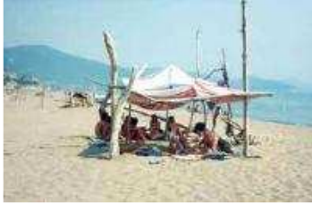
Jahresgruppenteilnehmer am Strand