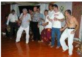
Jahrestraining-Männer beim Festauftritt

Nun setzt sich immer eine Frau auf diesen Platz zu den Männern (und entsprechendes, auch im weiteren Verlauf, umgekehrt bei den Frauen). Die Männer dürfen dieser Frau Fragen stellen, was sie von Frauen allgemein und speziell von dieser Frau wissen wollen, vielleicht über ihre Erfahrungen mit Männern oder ihre Gedanken und Gefühle als Frau. Man kann sich vorstellen wie interessant so eine Struktur sein kann, und wie schön, wenn auch aufregend, für alle, die da sitzen, mit einer positiven Absicht gefragt zu werden. Männer, die mehr über Frauen wissen wollen, sind ein Geschenk. Und umgekehrt ebenso Frauen, die sich wirklich für die Themen und Anliegen von Männern interessieren.