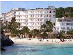
Das Hotel in Cala Santanyi