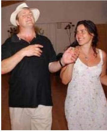
Die Fotos wurden auf Mallorca während des Jahrestrainings aufgenommen.

Frau Beziehung hinaus. Das hat mir geholfen in der bitteren Trennungsphase (vor wenigen Wochen) in einer liebevollen Haltung zu bleiben und auf eine gute Art Abschied zu nehmen.