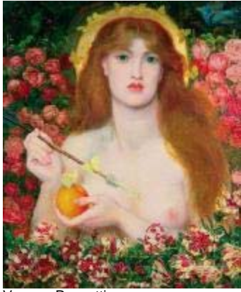
Venus - Rossetti