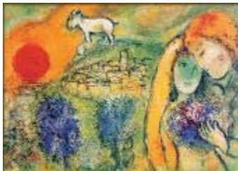
Die Liebenden von Vence - Chagall

Wie gelingt uns das als Paar, vielleicht auch Elternpaar, eingebunden im familiären und beruflichen Alltag, wenn die Liebe auf harte Zeiten trifft oder mühsame, uninspirierte Gewohnheit geworden ist? Gerade wenn Alltagsstress, Sorgen und Anforderungen wachsen, soll die Partnerschaft das Grundgefühl vermitteln, dass sie trägt, gut tut und Kraft gibt. Für ein wertschätzendes, liebevolles Zusammensein, statt zehrender Beziehungskonflikte.